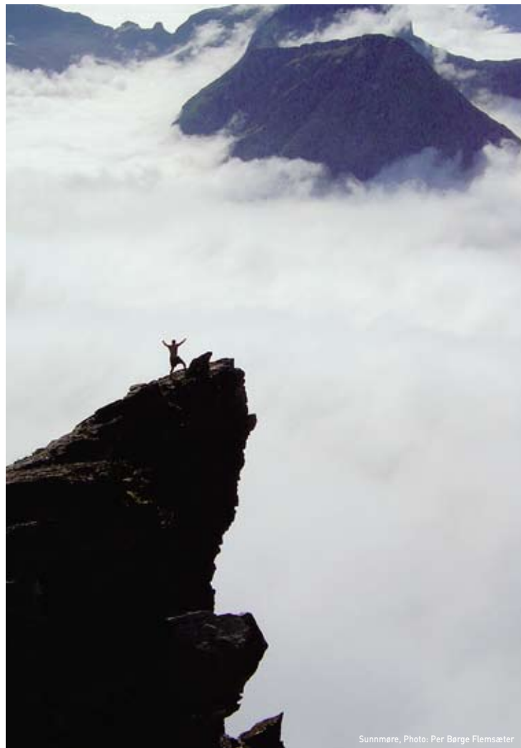
Sunnmøre, Photo: Per Borge Flemseter

Foto Titelseite: Jotunheimen, Terje Rakke/ Nordic Life AS/Innovasjon Norge