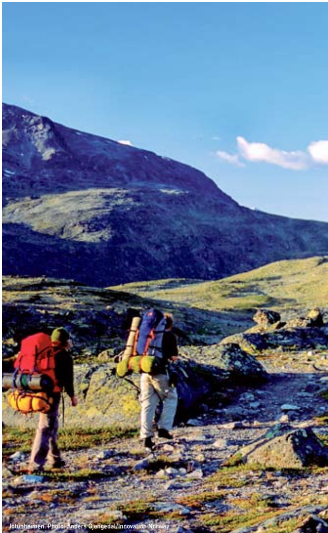
Jotunheimen, Photo: Anders Gjøgedal/Innovation Norway