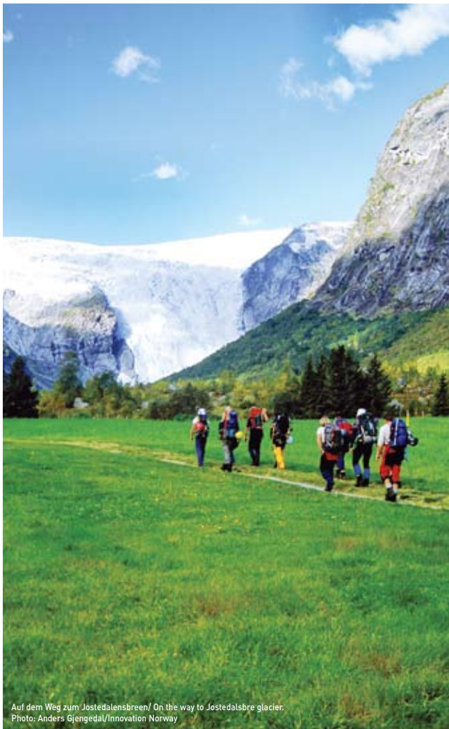
Auf dem Weg zum Jostedalensbreen / On the way to Jostedalsglacier.